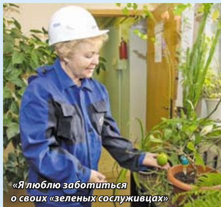
«Я люблю заботиться о своих «зеленых сослуживцах»»

Наша работа начинается «с нуля» в полном смысле этого слова. Мы приезжаем на пустырь, где будет располагаться строительная площадка, а пока там совсем ничего нет. Через некоторое время начинают вырисовываться очертания будущего здания: сначала котлован, потом фундамент, стены, двери, окна. Когда любишь полученным результатом, невольно начинаешь чувствовать себя немножко создателем! Ну, разве это не прекрасно?!