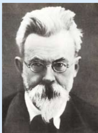
ВЛАДИМИР ИВАНОВИЧ ВЕРНАДСКИЙ (28 февраля 1863, Санкт-Петербург — 6 января 1945, Москва) — русский и советский естествоиспытатель, мыслитель и

В ЭТОМ ГОДУ РАЗРАБОТАН И РЕАЛИЗУЕТСЯ СОВМЕСТНЫЙ ПЛАН МЕРОПРИЯТИЙ ФОНДА ИМЕНИ В.И. ВЕРНАДСКОГО И ООО «ГАЗПРОМ ТРАНСГАЗ МОСКВА» НА 2013–2014 ГГ. ПЛАНОМ ПРЕДУСМОТРЕНО УЧАСТИЕ В КОНФЕРЕНЦИЯХ, СЕМИНАРАХ И МЕРОПРИЯТИЯХ ФОНДА, ПОСВЯЩЕННЫХ 150-ЛЕТИЮ СО ДНЯ РОЖДЕНИЯ В.И. ВЕРНАДСКОГО, ПУБЛИКАЦИЯ СТАТЕЙ И ИНФОРМИРОВАНИЕ РАБОТНИКОВ ОБ УЧЕНИИ В.И. ВЕРНАДСКОГО, ОРГАНИЗАЦИЯ СОВМЕСТНЫХ АКЦИЙ В РАМКАХ ГОДА ЭКОЛОГИИ В ОАО «ГАЗПРОМ».