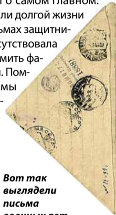
Вот так выглядели письма военных лет