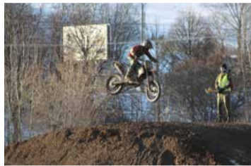
Из грязи в полет