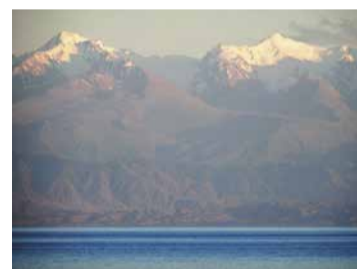
Другой берег Иссык-Куля