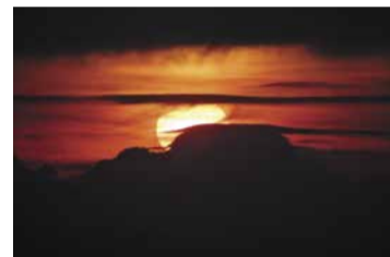
Закат на Красной поляне