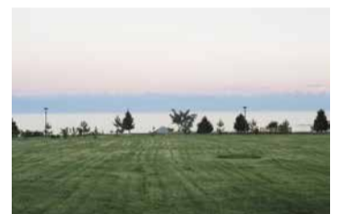
Тянь-Шаньский хребет на закате