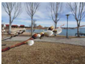
Весна на Иссык-Куле