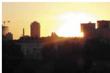
Закат — Воронеж