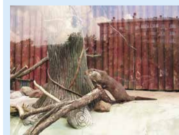
Муженек, выходи, хватит дрыгнуть! Я наш вольер на московскую квартиру обменяла!