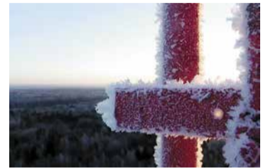
Морозное утро — КС «Воскресенск»