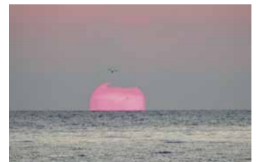
Закат на море