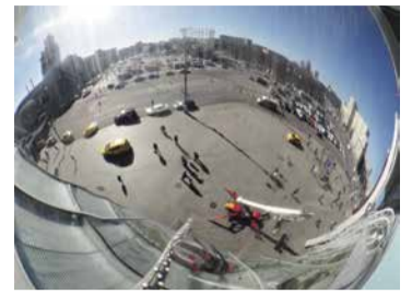
Жизнь в отражении