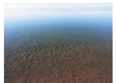
Иссык-Куль на рассвете