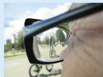
Может, я это — только молоде, Не всегда мы себя узнаем... (Н.Н. Добронравов)