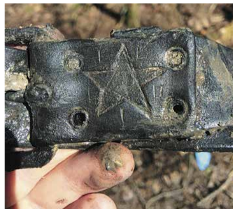
Солдатская пряжка, найденная во время поисковых работ сотрудниками УТТиСТ