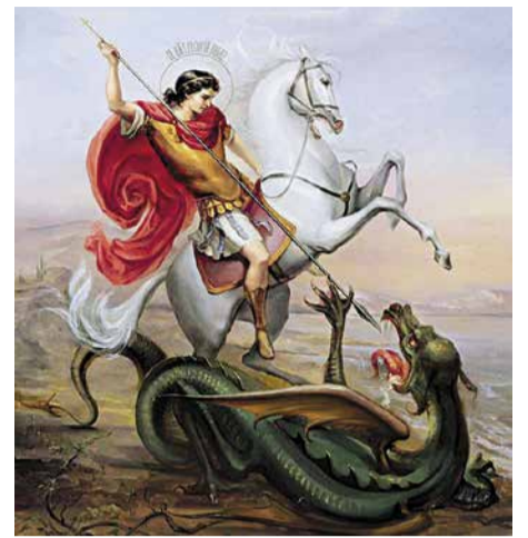
Святой Георгий Победоносец — покровитель воинства

Еще в советское время над студентами проводили эксперимент. Те, кто перед лекцией полчаса смотрел телевизор, не способен был потом эту лекцию усвоить. Уже в 70-е годы было известно, определено, что все эти новые технологии имеют своих режиссеров и дирижеров. Я тоже не считаю,