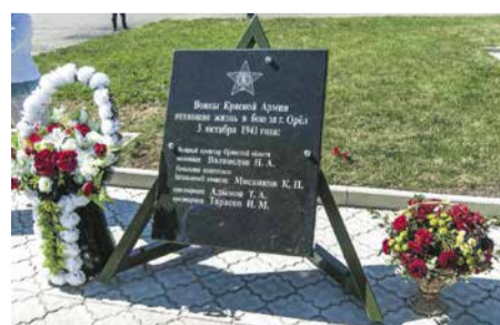
«Вахта памяти» в Орловском ЛПУМГ (апрель — май 2017 г.) и УТТСТ (октябрь 2016 г. — май 2017 г.)