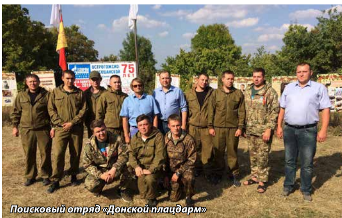
Поисковый отряд «Донской плацдарм»