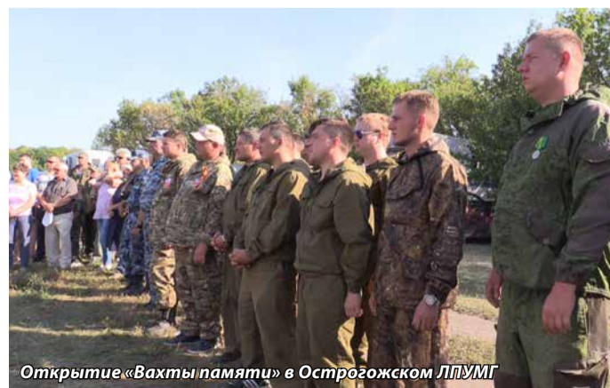
Открытие «Вахты памяти» в Острогожском ЛПУМГ