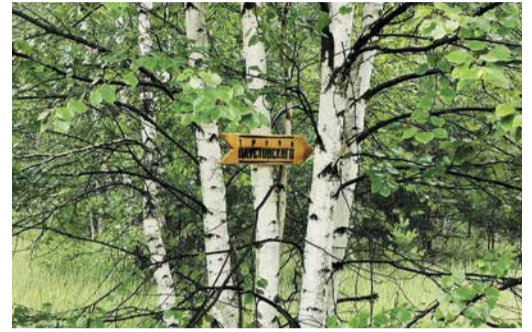
КНИГА ПРИРОДЫ Тропой К.Г. Паустовского Стр. 12