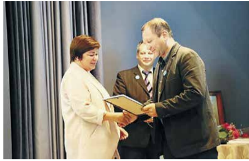
25 ЛЕТ ЦДИР Работа и праздник в Зименках Стр. 4