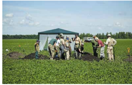
«ВАХТА ПАМЯТИ» В КУРСКОЙ ОБЛАСТИ Тематическая вкладка «Прометей» Стр. 5-8