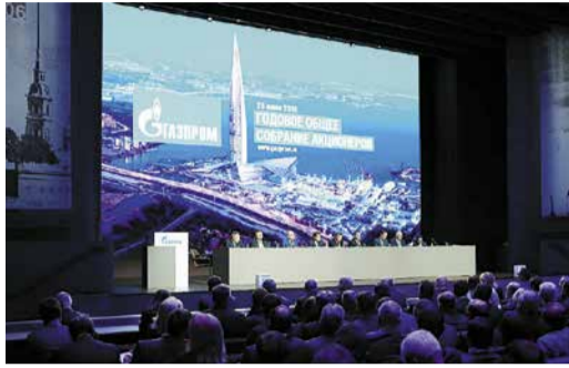
СОБРАНИЕ АКЦИОНЕРОВ ПАО «ГАЗПРОМ»-2019 ... Готовы к решению новых задач Стр. 3