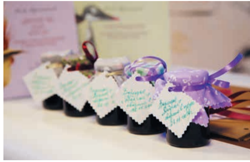
ЛИТЕРАТУРНОЕ ВАРЕНЬЕ Встречи на «Безумном чаепитии» Стр. 6