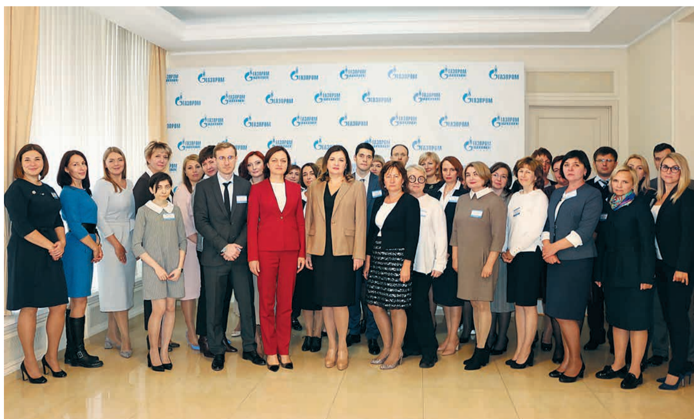
Финансово-экономический блок ООО «Газпром трансгаз Москва»

— Какие цели и задачи Вы ставите перед курируемыми Вами подразделениями в перспективе будущего года?