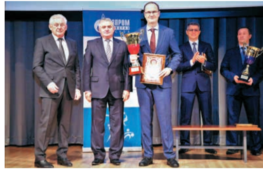
СЧАСТЛИВЫЙ МИГ ПОБЕДЫ VII Спартакиада администрации Стр. 9-10