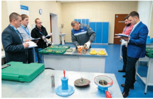
СТАРТ ПИЛОТНОГО ПРОЕКТА Независимая оценка в УПЦ Стр. 5