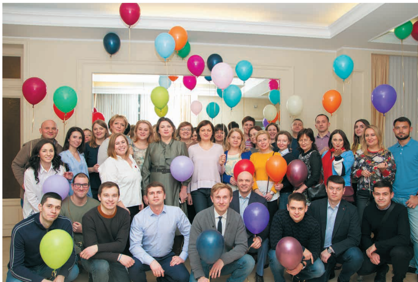
Семинар финансово-экономического блока в Зименках