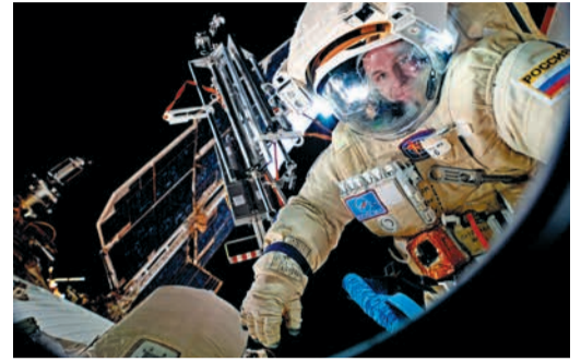
НЕБО В КОСМОСЕ ДРУГОЕ... Считает космонавт Сергей Рязанский Стр. 11-12