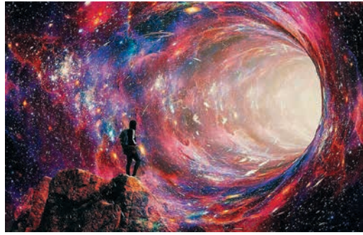
ГАЗОВИКИ ГАЛАКТИКИ Космические профессии апреля Стр. 5-8