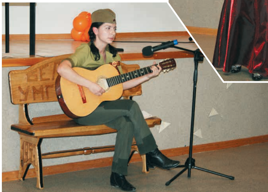
На концерте ко Дню Победы