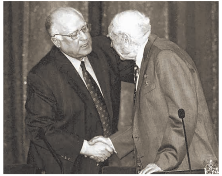
«Нефтяник № 1» — так называл Н.К. Байбакова В.С. Черномырдин

сотратников А.Н. Косыгина — государственного деятеля, реформатора, председателя Совета министров СССР. А задачи в то время стояли серьезные: речь шла о перестройке всей структуры Госплана СССР.