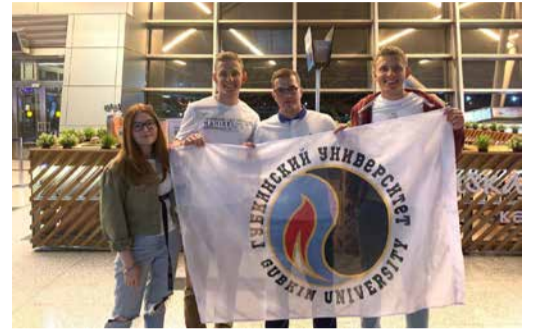
НОВОЕ ПОКОЛЕНИЕ Растет достойная смена Стр. 11