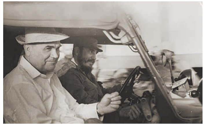
Н.К. Байбаков с верным другом Ф. Кастро

Советское правительство высоко оценило заслуги Николая Константиновича Байбакова. За высокие трудовые достижения ему было присвоено звание Героя Социалистического труда (1981). За открытие и разработку газоконденсатных месторождений Н.К. Байбаков был удостоен Ленинской премии (1963). За многолетний добросовестный и плодотворный труд награжден шестью орденами Ленина, двумя орденами Трудового Красного Знамени, орденом Октябрьской Революции, многими медалями СССР и наградами зарубежных государств, а позже — орденом «За заслуги перед Отечеством» II степени (2006). Неоднократно был отмечен Благодарностью Президента Российской Федерации (1996 и 2001) за большой вклад в развитие экономики страны и топливно-энергетического комплекса. Он лауреат премии города Москвы «Легенда века», лауреат главной всероссийской премии «Российский Национальный Олимп» — «Человек-эпоха».