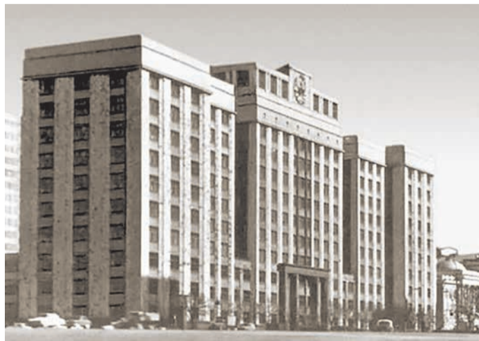
Легендарное здание Госплана СССР, г. Москва

В следующем году наступили новые времена с приходом к власти Л.И. Брежнева. С октября 1965 года Н.К. Байбаков вернулся в Госплан вместе со многими своими бывшими сотрудниками, имеющими уникальный опыт экономической работы в военное и послевоенное время, стал работать председателем Госплана СССР и заместителем председателя Совета Министров СССР. Он был одним из ближайших