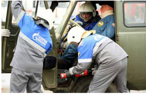
К НЕШТАТНЫМ СИТУАЦИЯМ ГОТОВЫ Надежно и безопасно Стр. 2