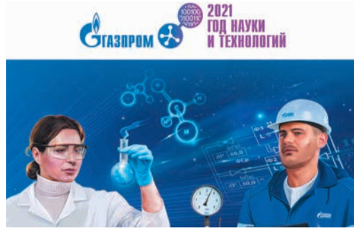
ГАЗОВИКИ ГАЛАКТИКИ Финальные профессии вкладки Стр. 5-8