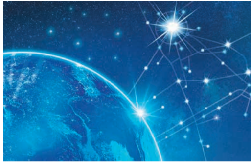
В ПРАЗДНИЧНОЙ АТМОСФЕРЕ На новом старте Стр. 3, 4, 9, 10