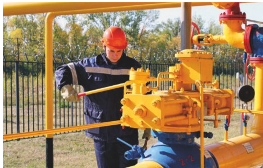
Трубопроводчик линейный обслуживает линейную часть МГ, контролирует состояние защитного покрытия трубопроводов и сооружений, выполняет вспомогательные работы при вскрытии траншей трубопроводов, сварке, продувке и испытании, при ремонте запорной арматуры, водосборников и других устройств и сооружений на трубопроводе