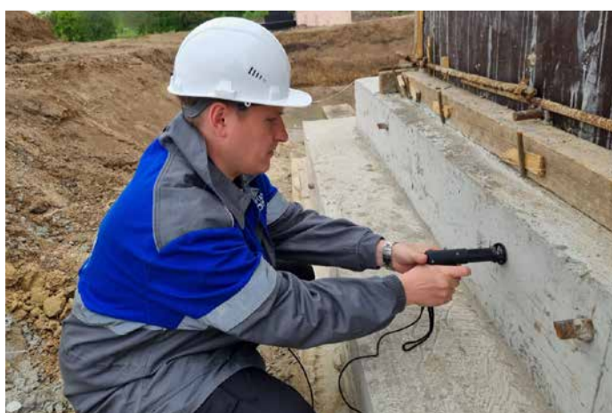
Замеры прочностных характеристик бетона на объекте строительства