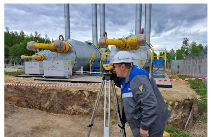
Нивелировка высотных отметок фундамента