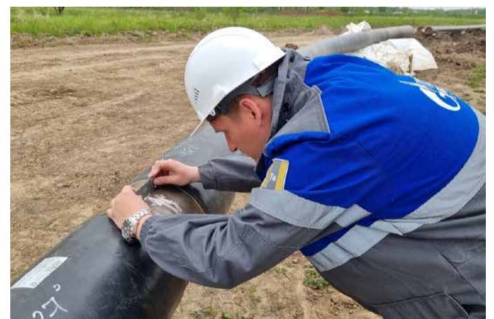
Визуально-измерительный контроль сварного соединения