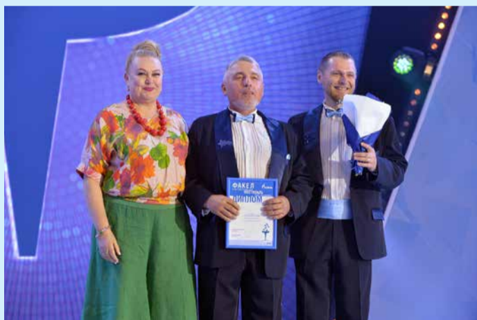
Награда ансамблю «Русский мотив»