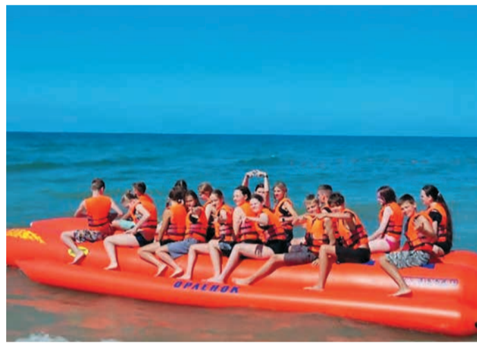
В детском центре «Орленок»

— Именно летний отдых позволяет им стать сильнее, укрепить здоровье, обзавестись новыми знакомствами и конечно вернуться домой совсем другими, повзрослевшими. В предыдущие годы дети работников компании традиционно направлялись на отдых в Крым и подмосковный лагерь. В этом году мы решили провести эксперимент и отправить их в крупнейший, один из лучших в России детских лагерей Всероссийский детский центр «Орленок». Он расположен на Черноморском побережье Краснодарского края. Само это место, условия размещения отдыхающих уже были высоко оценены руководством Газпрома. В 2015 году на базе «Орленка» проводилась детская летняя Спартакиада. В общей сложности на Черноморском побережье в «Орленке» за четыре смены отдохнуло и укрепило свои силы 700 детей работников — на 13% процентов больше чем в 2022 году. Это значит, что еще 81 ребенок в текущем году увидел море, погрелся на солнышке и обзавелся новыми знакомствами.