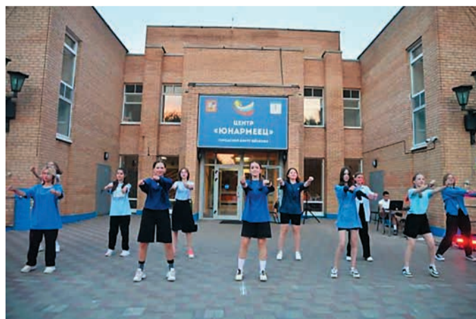
В подмосковном лагере «Юнармеец»

В современном мире дети все больше времени проводят в различных гаджетах. Именно поэтому условия пребывания в лагере предусматривают минимизацию использования смартфонов. Конечно, от этой зависимости не так просто избавиться, но организаторы в качестве альтернативы вовлекают детей в деятельность разных кружков с учетом пожеланий детей.