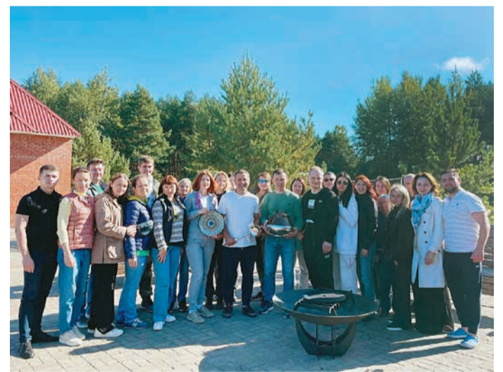
Дружеский выезд на Селигер

Мы продолжаем активный поиск новых проектов на Селигере. И в этом году сделали еще один шаг. У многих работников компании за предыдущие периоды сформировался резерв неиспользованных отпусков. Это проблема, над которой работаем по всем направлениям. В том числе ввели практику проведения командообразующих мероприятий, спортивных соревнований, конкурсов, фестивалей и много другого. В качестве интересного опыта можно привести пример коллективного выезда Управления по работе с персоналом осенью этого года. Трехдневный выезд был проведен за счет ранее накопленных отпусков работников по путевкам, стоимость которых компенсируется на условиях Коллективного договора. Когда организовывали выезд, вспомнили также о наших заслуженных пенсионерах, которые охотно откликнулись на наше предложение и присоединились к коллективу Управления. Мы позвонили многим пенсионерам, и те, кто не смог поехать, были благодарны за оказанное внимание. По просьбе коллектива был выделен корпоративный автобус. В октябре ветераны компании планируют закрепить этот опыт и организованно отдохнуть в кругу друзей.