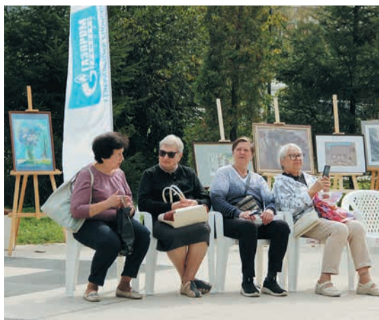
Палитра Форума древних городов в Рязани