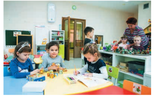
«ЗОЛОТОЙ ПЕТУШОК» ПРИГЛАШАЕТ Атмосфера добра, любви и комфорта Стр. 12