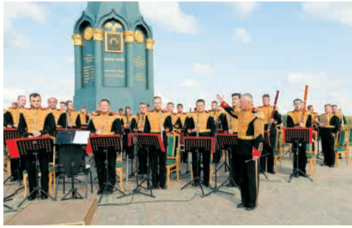
ПЕРВЫЙ «ШАГ» СДЕЛАН Проект «Шаги Победы» в Бородино Стр. 5-6