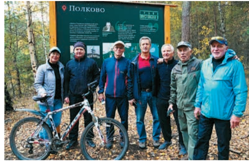
«ТРОПА ПАУСТОВСКОГО» В СОЛОТЧЕ Маршрутами писателя — на велосипедах Стр. 10