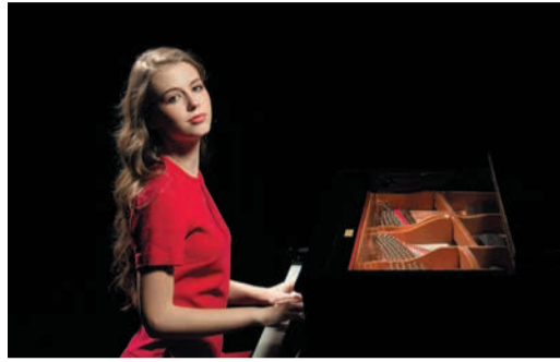
JUNIOR MUSIC TOUR ПРОДОЛЖАЕТСЯ 3-й сезон открылся Стр. 10