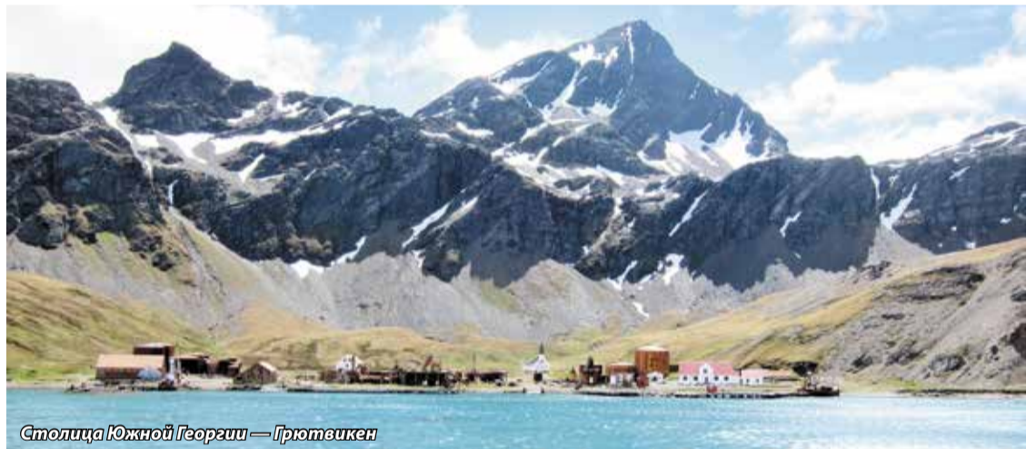
Столица Южной Георгии — Грютвикен

— Наверное, под опекой опытных проводников?