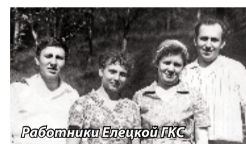
Работники Елецкой ГКС