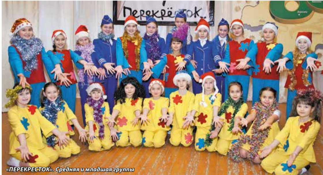
«ПЕРЕКРЕСТОК». Средняя и младшая группы

21 декабря народный коллектив современного танца «Перекресток» будет праздновать свой юбилей на сцене родного Дома Культуры. Название праздничной программы — «Нам только 10». Поздравляю руководителя коллек-