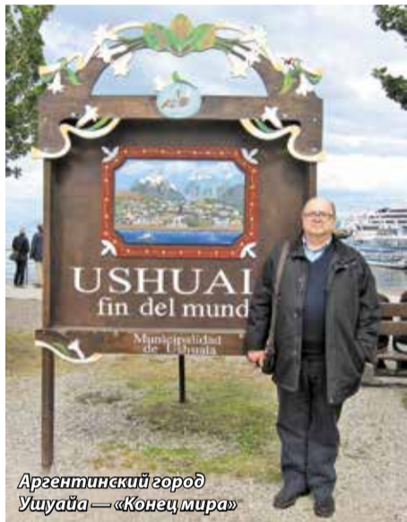
Аргентинский город Ушуйа — «Конец мира»