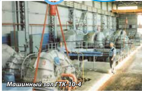
Машинный зал ГТК-10-4