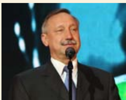
Представитель Президента РФ в Центральном федеральном округе Александр Беглов:

– Дорогие друзья, я очень рад приветствовать вас на белгородской земле в Центральном федеральном округе на корпоративном фестивале творческих коллективов. Замечательно, что этот фестиваль проходит здесь в Центральном федеральном округе. А что такое Центральный федеральный округ? Это прежде всего коренная Русь. А чем вы занимаетесь? Кого и что вы представляете? Вы представляете сегодня народы России, которые населяют Центральный федеральный округ и в целом нашу с вами великую и прекрасную страну. Если говорить об организаторах этого мероприятия, «Газпром трансгаз Москва», возрождает нашу с вами историю, нашу культуру. В этом фестивале не имеет значения возраст. Самое главное талант, любовь к искусству и к нашей родине. Я хотел бы поблагодарить организаторов и участников этого фестиваля, пожелать открытия звездочек и хорошего настроения! В мире по-всякому складывается... У нас, как правило, 50% хорошего и 50% может быть нехорошего, но все зависит от того, как человек смотрит на жизнь. А на жизнь он должен смотреть только позитивно, тогда настроение будет хорошее и в доме хорошо, а раз в доме хорошо, то и в регионе хорошо, а раз в регионе хорошо, значит, и в стране хорошо! Желаю вам хорошего, бодрого настроения!