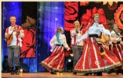
Ансамбль народной музыки «Раштав», г. Нижний Новгород.

– Какие впечатления от фестиваля? Как вас приняли?