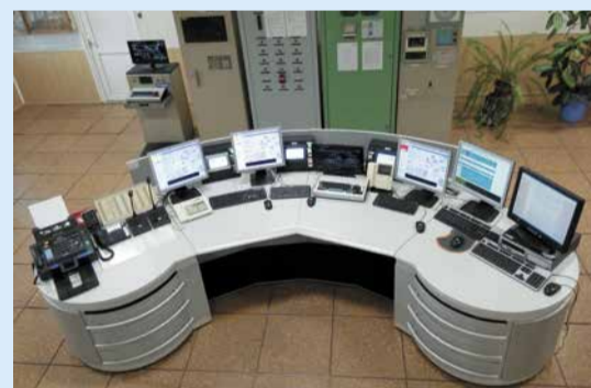
Система автоматического управления газоперекачивающими агрегатами ЭГПА-25 ст. №1, 2, 3 на КС-27 «Павелецкая» (САУ ГПА-25 «КВАНТ-11Э»)

В ходе работ заменена большая часть устаревших датчиков, первичных измерительных преобразователей, выработавших ресурс мониторов САУ, климатического оборудования в блок-боксах САУ ГПА и КЦ, серверной, операторной и ГЩУ. Аналогов демонтированного оборудования на настоящий мо-