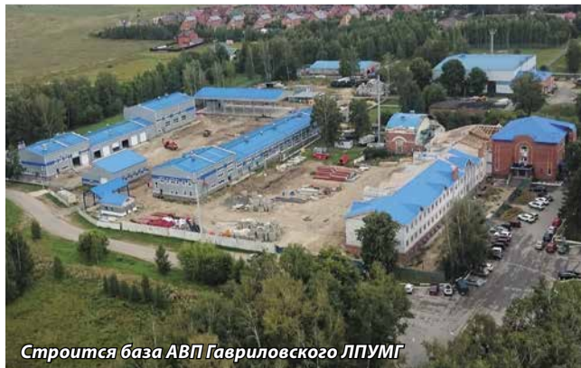
Строится база АВП Гавриловского ЛПУМГ