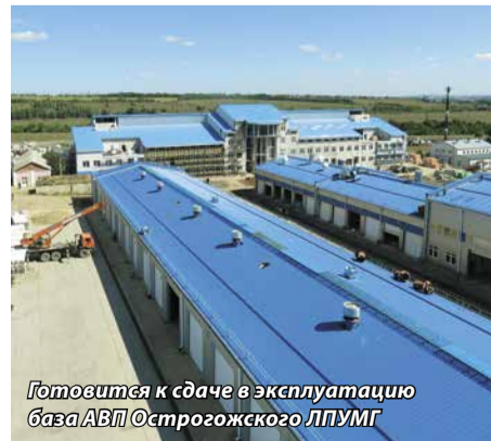
Готовится к сдаче в эксплуатацию база АВП Острогожского ЛПУМГ