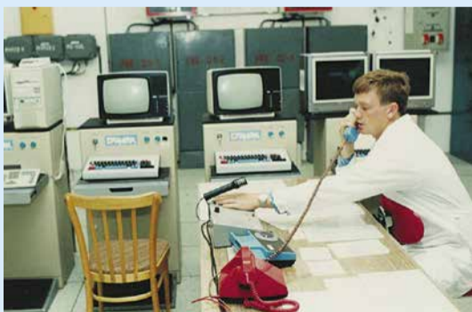
Старое рабочее место сменного инженера на ГЩУ КС с САУ «Марк» чешского производства

В рамках мероприятий по подготовке оборудования к осенне-зимнему периоду эксплуатации 2015–2016 гг., а также выполнения Комплексной программы повышения надежности компрессорных станций ООО «Газпром трансгаз Москва» завершены работы по капитальному ремонту физически и морально устаревшей САУ ГПА «Марк» чешского производства на КС-27 «Павелецкая» Путятинского ЛПУМГ с применением КМЧ «Квант-11Э» на всех трех установленных ЭГПА-25 ст. № 1, 2, 3. Выполнены испытания, антипомпажные тесты и обкатка ЭГПА с загрузкой в трассу.