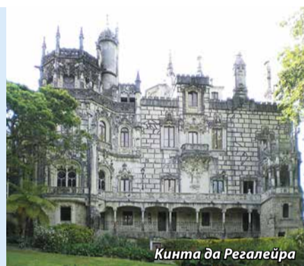
Кинта да Регалейра