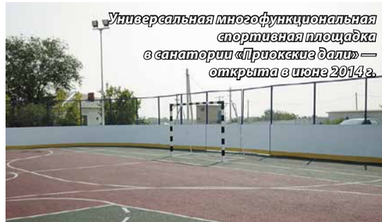
Универсальная многофункциональная спортивная площадка в санатории «Приокские дали» — открыта в июне 2014 г.

специалист. В заслугу ему можно поставить и то, что он очень грамотно выстраивает отношения с местными властями, что также важно в нашей работе. Зная это, я инициировал включение его в команду для работы на олимпийских объектах. Там, кстати, все ребята хорошо себя проявили, поработали на совесть, хотя режим был достаточно тяжелый.