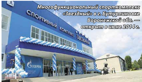
Многофункциональный спорткомплекс «Звездный» в г. Бутурлиновке Воронежской обл. — открыт в июне 2014 г.