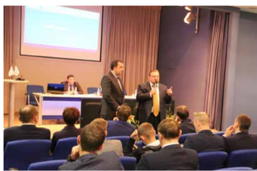
«ДЕЛАЕТЕ БЛАГОРОДНОЕ ДЕЛО»