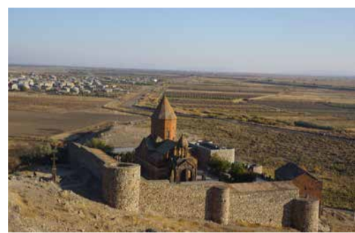
СЧАСТЬЕ — МЕНЯТЬ ГОРИЗОНТЫ

Путешествие в Беларусь и Армению Стр. 9, 11