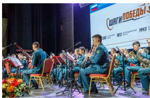
«ШАГИ ПОБЕДЫ» В КУРСКЕ

Конкурс чтецов на пути к финалу Стр. 5, 8