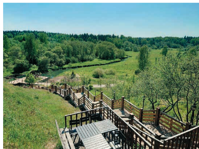
Спуск к купели и Святому источнику в Радонеже