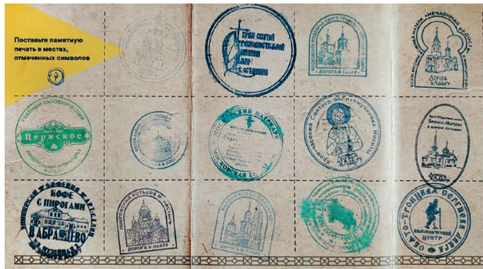
Эту дорогу ты прошел сам

Наталья КАРЦЕВА